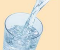
飲料水、 清涼飲料水(※)、 氷

(※)ガラス瓶入りのもの(紙栓をつけたものを除く。)又はポリエチレン製容器入りのものに限る。