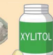
チューイング ガム